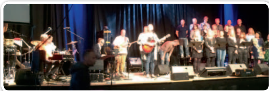
Lena synger på Sommer-konference.

Mens jeg skriver, er jeg på Island, og det har været en dejlig og opmuntrende tur. På sommerkonferencen for alle pinsemenigheder heroppe blev vi modtaget med varme og kærlighed. Jeg fandt hurtigt ud af, at mine sange er blevet spillet gennem 25 år i deres kristne radio, som sender 24 timer i døgnet. Det vil sige, at de har hørt min stemme mange gange, men aldrig set eller mødt mig.